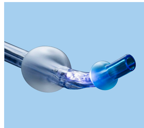
Ambu® VivaSight™ 2 DLT.